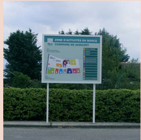
Signalétique mise en place sur la zone du Boscq en mai 2010

L'OCM (Opération Collective de Modernisation) de Pays permet aux entreprises artisanales et commerciales de bénéficier d'aides à l'investissement. Le taux de subvention vient d'être revu à la hausse : il passera à 30%, à partir de juillet 2010, pour des investissements allant de 6000 € à 75000 € HT. Contact : Guillaume Solana (Chambre de métiers et de l'artisanat) au 05 58 05 81 70.