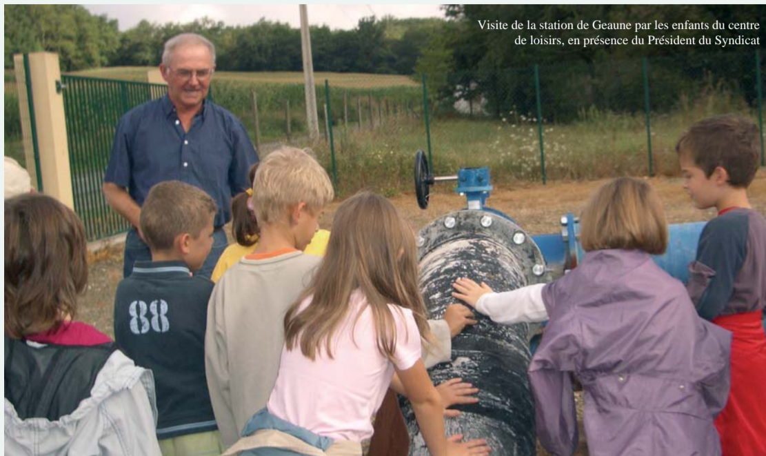
Visite de la station de Geaune par les enfants du centre de loisirs, en présence du Président du Syndicat

2010 marque le 15 e anniversaire de la régie du Syndicat des Eaux du Tursan, créé en 1955, qui regroupe 84 communes dans les Landes et les Pyrénées-Atlantiques.