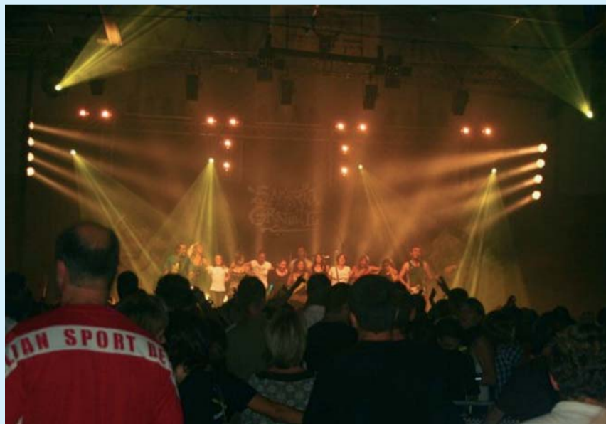
Le groupe "Sangria Gratuite" en 2009

Forte du succès de la précédente édition, l'association Club Arboucave Sport et ses 80 bénévoles organisent le samedi 9 octobre la Rue du Bizeou , avec une affiche des plus prometteuses.