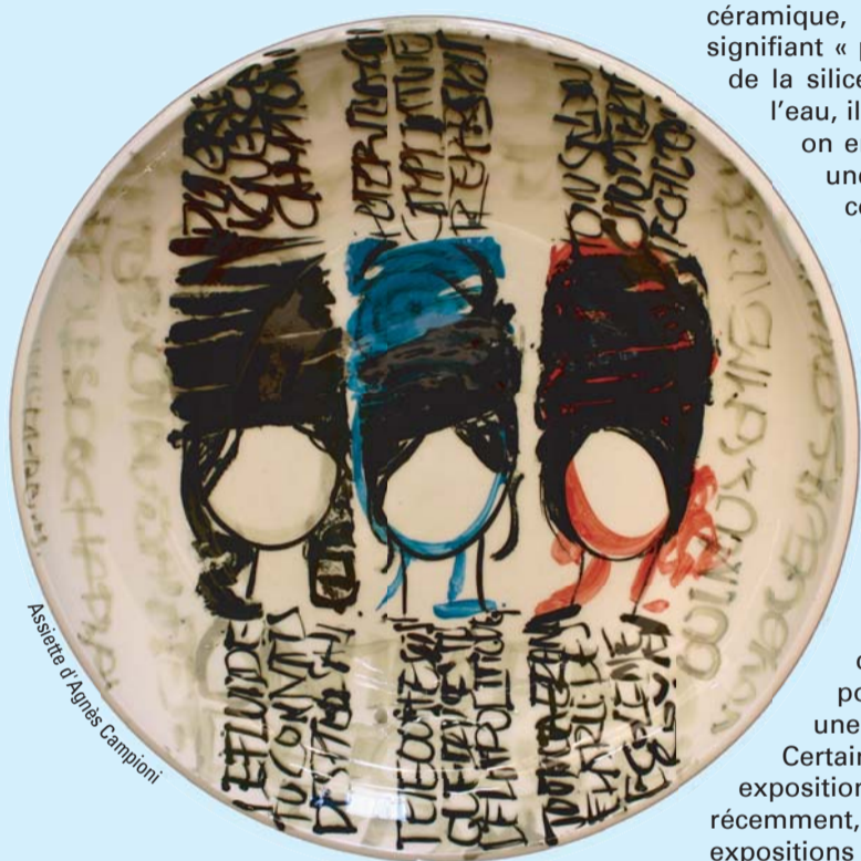
Assise d'Agnès Campioni

Renseignements au 05.58.79.65.45 et au 05.58.44.50.01 - www.tursan.org Maison de la céramique (au cœur du village) Place de la Faïencerie - 40 320 SAMADET