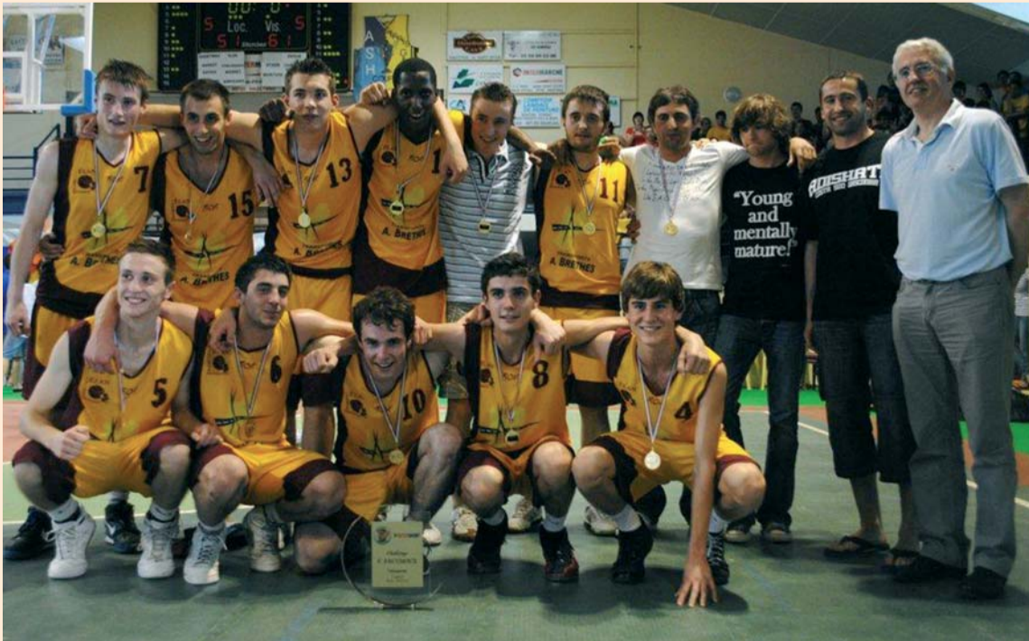
Victoire des Cadets de l'Elan Tursan Basket