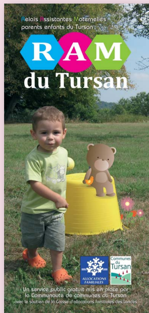
Dépliant du RAM du Tursan