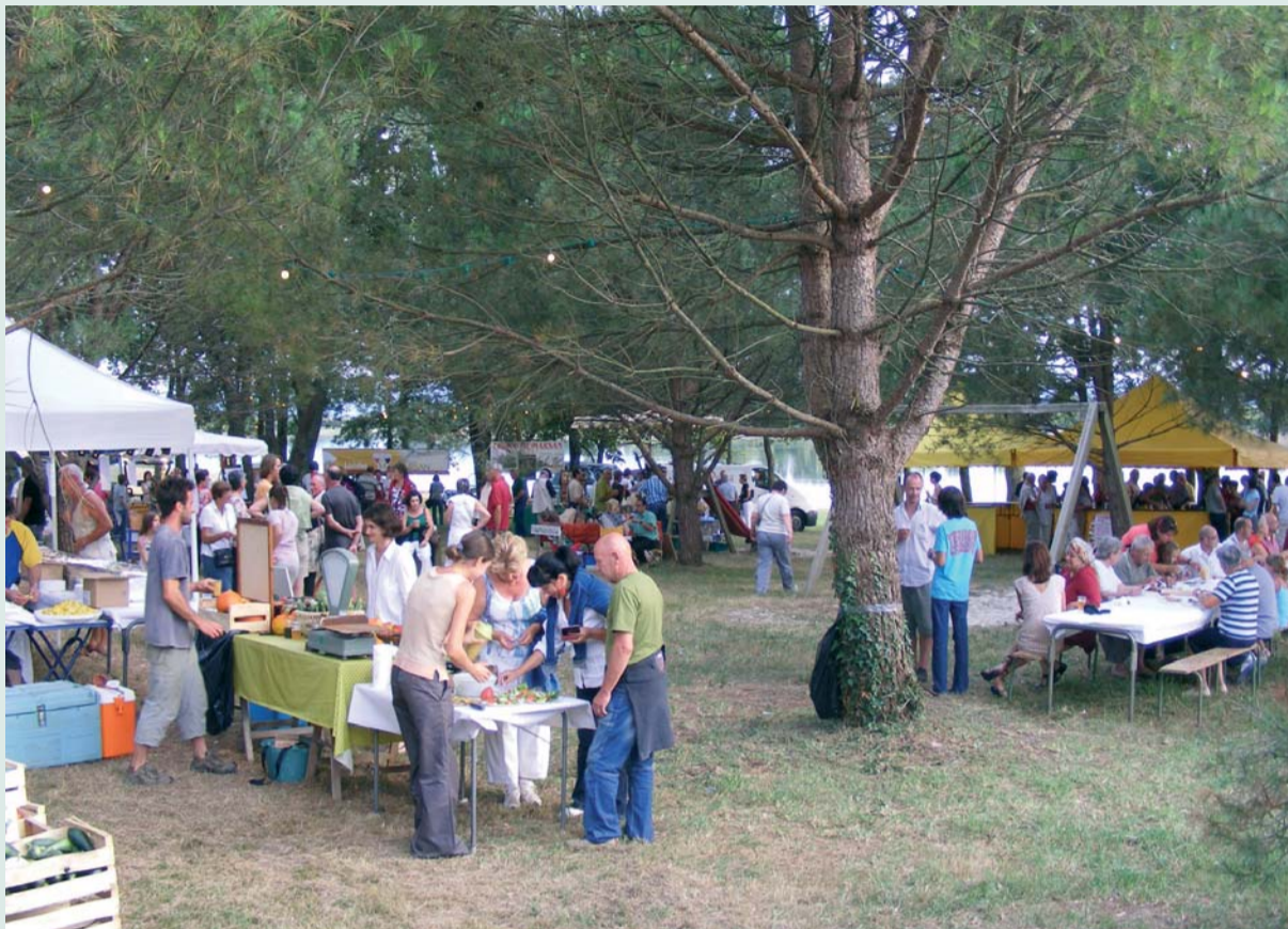
Le marché de Miramont en 2009

L'Office de tourisme 2* du Tursan innovait en 2009 en organisant des marchés de producteurs. Comme annoncé dans la Voix du Tursan de janvier, les marchés de Miramont-Sensacq et Geaune seront reconduits cette année.