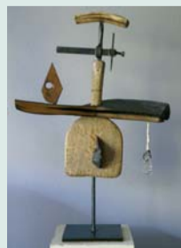
A droite : sculpture de l'atelier de Michel Gaubert